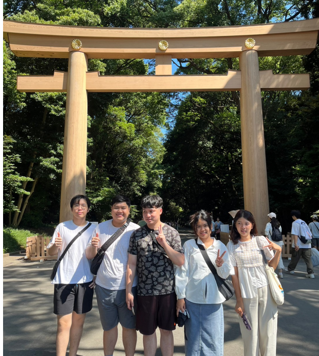
Asia Design Global Workshop 2023 Summer @ TOKYO (26 July - 4 August 2023)